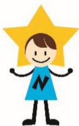
育成センターのマスコット